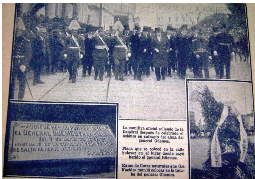
— ADULTO HERIDO POR REALISTAS EL GENERAL GÜEMES EN LA NOCHE del 7 de Junio de 1807. HOMENAJE DE LA COMISIÓN PRO PATRIA DE SALTA AL HEROE LEGENDARIO JUNIO 1921